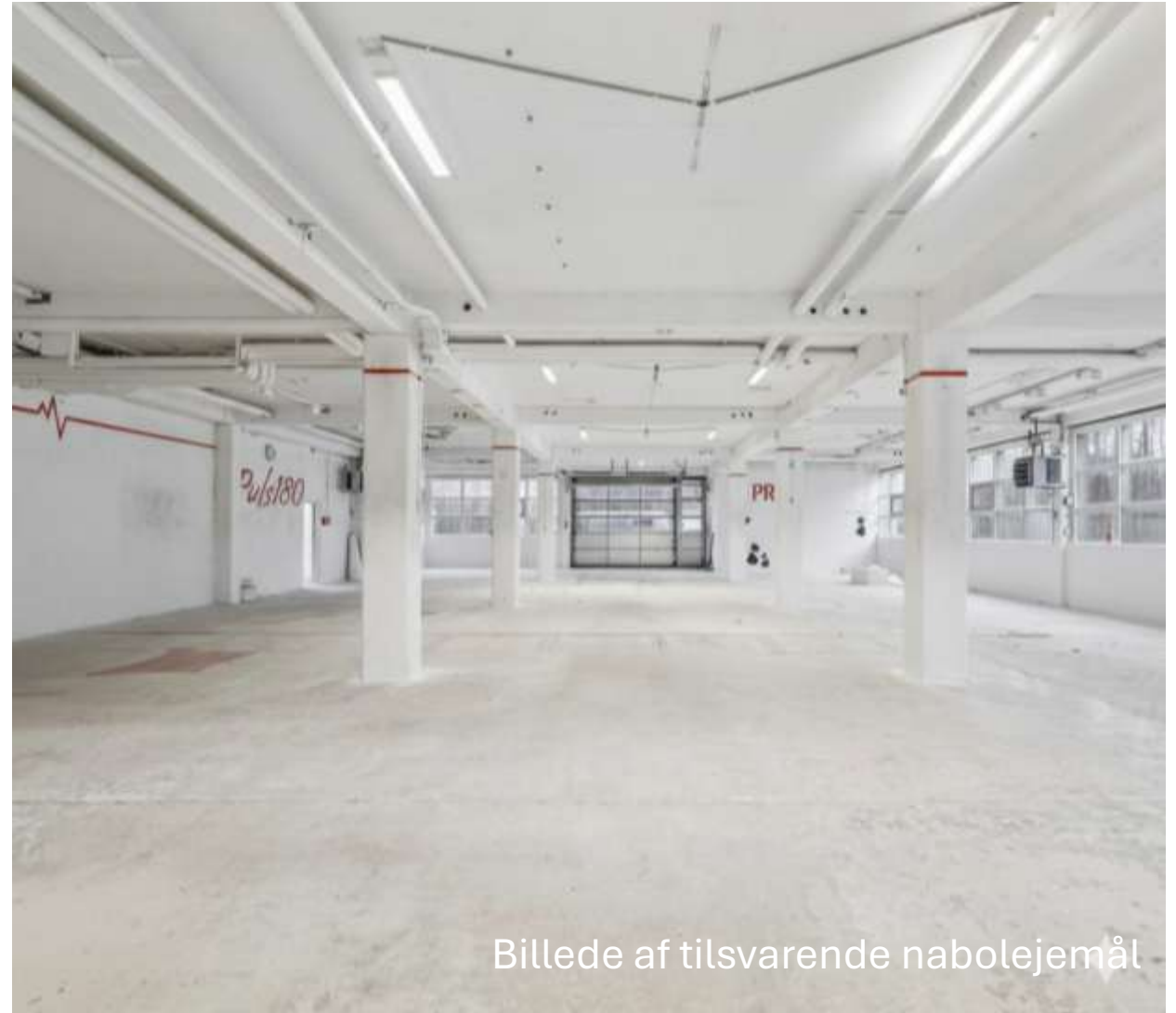
Billede af tilsvarende nablejemål