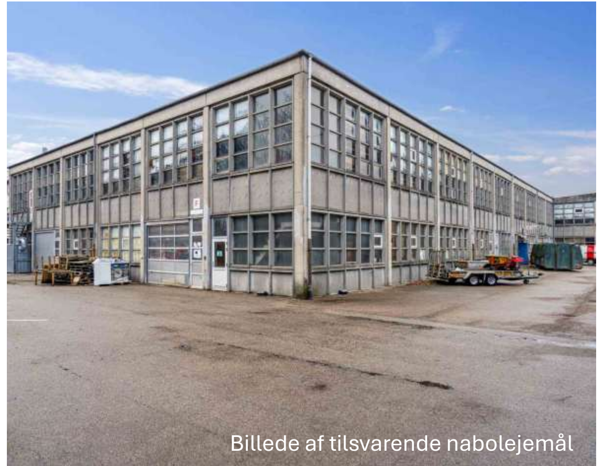
Billede af tilsvarende nablejemål

Der tages hermed forbehold for evt. fejl og mangler i dette prospekt.